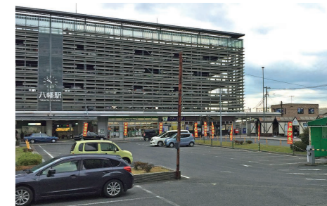
↑現在の八幡駅前広場