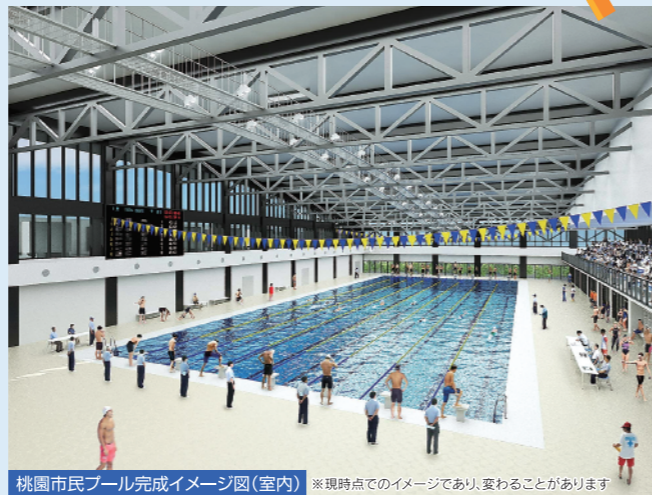
桃園市民プール完成イメージ図(室内) ※現時点でのイメージであり、変わることがあります