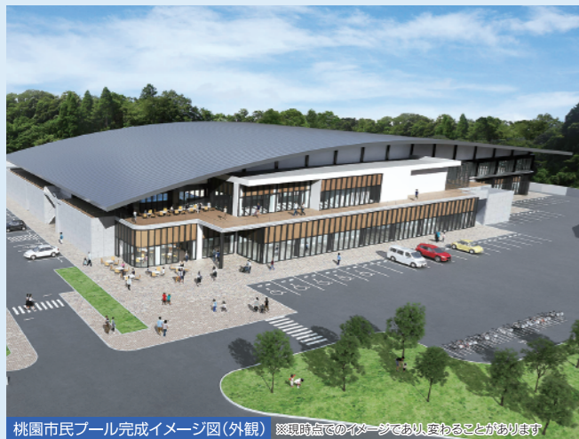
桃園市民プール完成イメージ図(外観) ※現時点でのイメージであり、変わることがあります

この整備により、一年を通して幅広い世代の体力づくりや健康づくりに利用できるほか、市内唯一の室内公認50mプール、25mのサブプール、観客席等が整備され県内や市内大会などに対応できます。また、屋外広場や休憩スペースも確保し、桃園公園の中心施設として、くつろげる魅力的な施設に生まれ変わります。